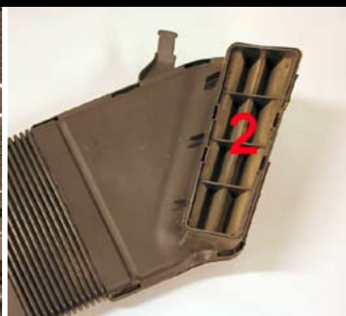
3. Demontera luftkanalens förfilter (2).