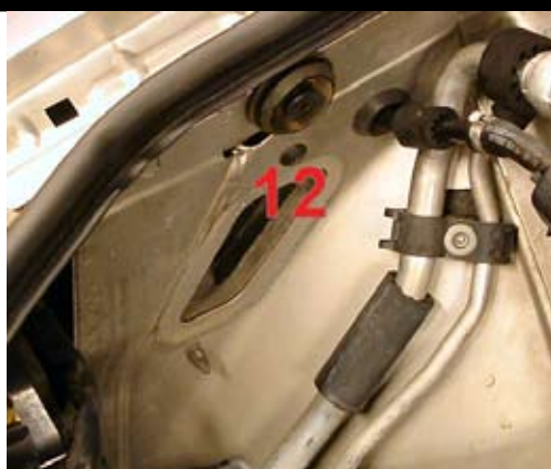
8. Demontera skruven från innerskärmen (12).