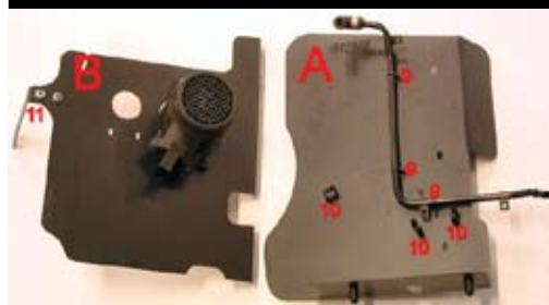
7. Förbered dom nya avskärmningsplåtarna: Flytta över luftmätaren och EVAP-röret. Montera EVAP-röret med hjälp av medföljande monteringsband på plåt A enligt bild 7, 3 fästpunkter (9). Montera de 3 klipsen (10) och staget (11).

Demontera luftfiltermodulen: Lossa den från den övre fästpunkten på innerskärmen först, genom att dra utåt. Drag modulen uppåt så den lossnar från gummifästena (8). Vik undan rör, slangar, och kablage samtidigt som du lyfter ur luftfiltermodulen.