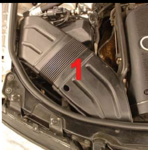
2. Demontera luftkanalen (1).