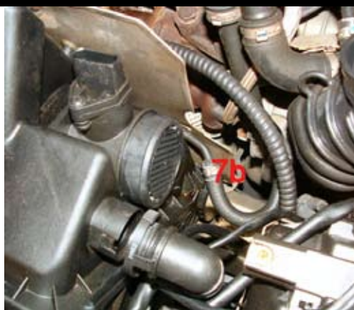
5. Avlägsna den undre slangklämma (7b) till EVAP-röret och lossa slangen.