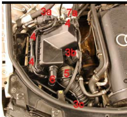
4. Demontera kablaget från luftfiltermodulen: Lossa kontaktstyckena till EVAP-ventilen (3a), luftmätaren (3b) och magnetventilen (3c). Lossa klipsen (4) som håller kablaget. Demontera insugningsslangen (5) från luftmätaren. Lossa sekundär-luftväg (6) från luftfiltermodulen. Avlägsna den övre slangklämma (7a) till EVAP-röret och lossa slangen. (EVAP-rör; sitter monterat på luftfiltermodulen under värmeskölden).