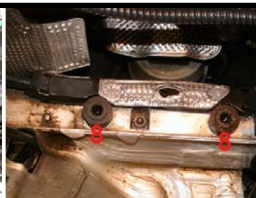
6. Använd original gummistyrningar (8) för monteringen.

Demontera luftfiltermodulen: Lossa den från den övre fästpunkten på innerskärmen först, genom att dra utåt. Drag modulen uppåt så den lossnar från gummifästena (8). Vik undan rör, slangar, och kablage samtidigt som du lyfter ur luftfiltermodulen.