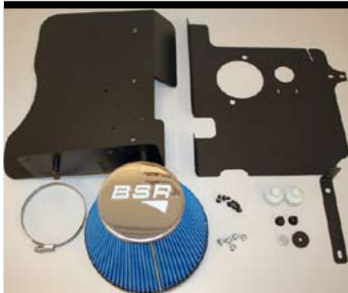
1. Innehållsöversikt optiflow.

Tänk på att inte dra åt för hårt vid montering av BSR luftfilter. Dra åt lätt, endast så filtret greppar. Kontrollera före och efter provkörning att allt sitter fast ordentligt.