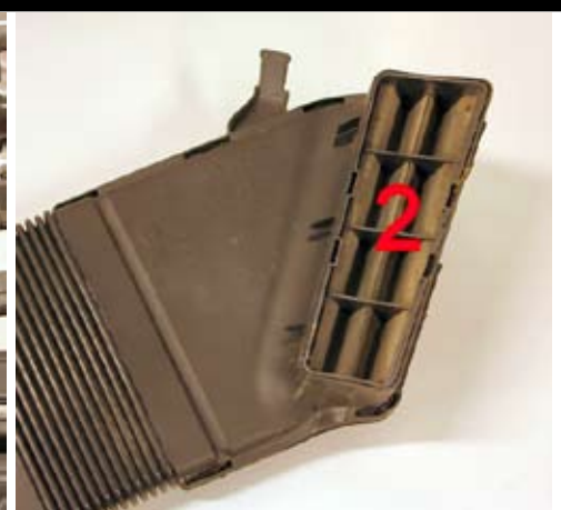
3. Demontera luftkanalens förfilter (2).