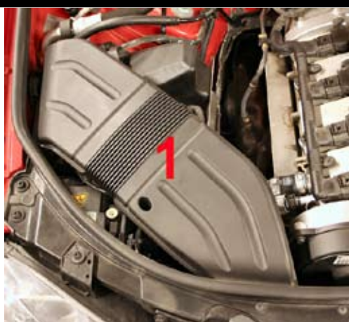
2. Demontera luftkanalen (1).