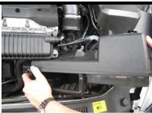
8. Lyft luftfiltermodulen rakt upp tills den släpper från gummifästena. Dra sedan modulen åt vänster samtidigt som du vrid den för att få upp den. Demontera styrdonet och luftmassmätaren från luftfiltermodulen.