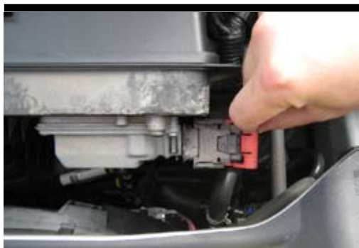
4. Demontera kontaktstyckena till styrenheten. Vik upp de båda röda låsbyglarna och dra ut kontaktstyckena.