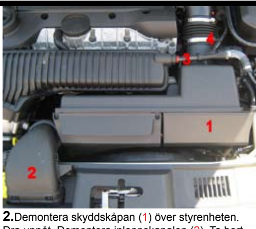
2. Demontera skyddskåpan (1) över styrenheten. Dra uppåt. Demontera inloppskanalen (2). Ta bort skruvarna och vrid 45 grader medurs för att lossa. Demontera vakuurröret (3) från insuget. Tryck in den röda låsringen och dra röret utåt. Demontera slangen (4) från luftmassmätaren.