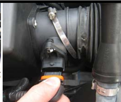
3. Bryt spänningen till batteriet. Lossa kontaktstycket från luftmassmätaren.