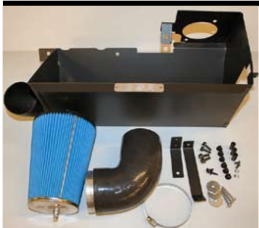
1. Innehållsöversikt optiflow