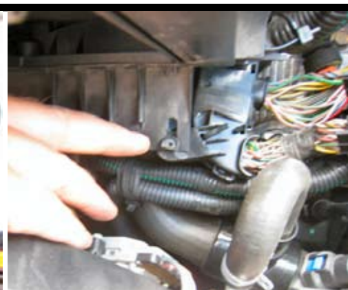
6. Vrid ner kabelstammen och haka ur den från luftfiltermodulen.