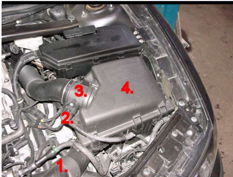
1. Demontering: Insugningsröret (1), kontaktstycket (2) till luftmätaren (3), luftmätaren från luftfiltermodulen (4).