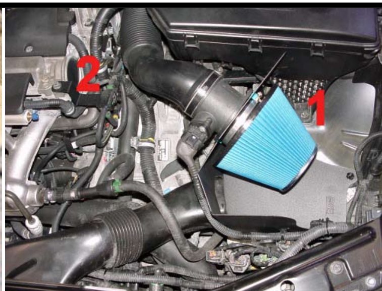
4. Demontera skruven (1) till säkringslådan. Montera klipsen (medföljer) till luftmätaren på avskärmningsplåten. Montera: Avskärmningsplåten i originalfästena och skruven till säkringslådan, luftmätaren i avskärmningsplåten med skruv (medföljer). Montera luftfilter, kontaktstycket till luftmätaren, insugningsröret och anslut magnetventilen enl. bild med hjälp av fäste (2) som medföljer.