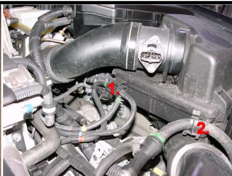
2. Demontera magnetventilen (1) och slangen (2) från luftfilterlådan.