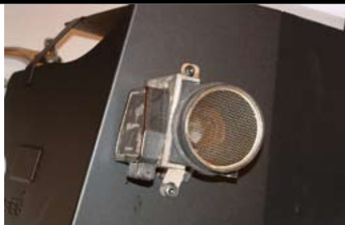
8. Montera LMM på avskärmningsplåten. Använd medföljande skruvar/muttrar/brickor.