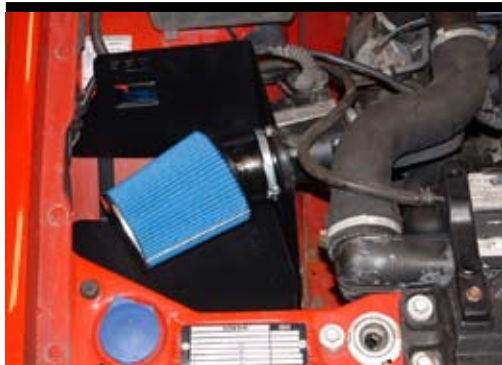
10. Återmontera inloppsslangarna till LMM och intercooler. Återmontera kontaktstyckena till LMM och luftventil. Montera BSR Sportluftfilter