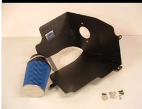
1. Innehållsöversikt opti-flow.