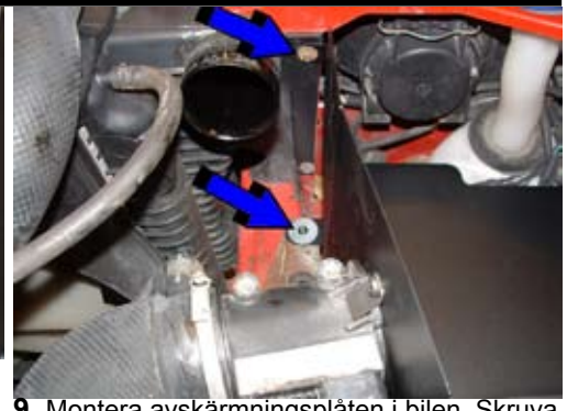
9. Montera avskärmningsplåten i bilen. Skruva fast enligt bild.