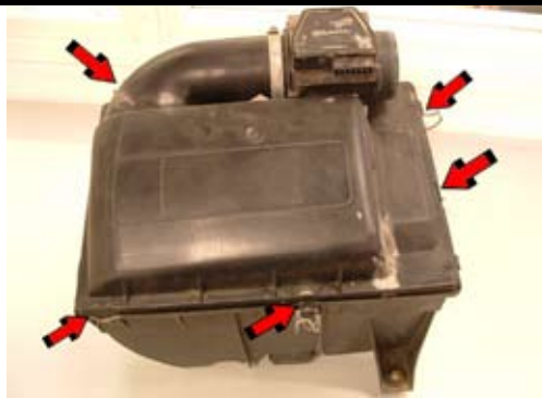
5. Öppna luftfiltermodulen.