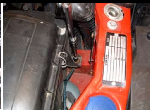
3. Lossa skruven enligt bild. Dra luftfiltermodulen uppåt för att lossa den. Vik undan slangar och kablar och lyft upp luftfiltermodulen.