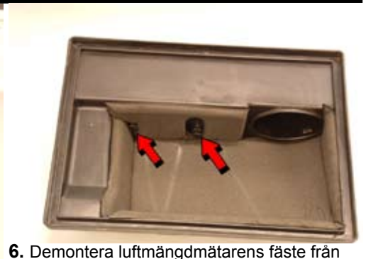
6. Demontera luftmängdmätarens fäste från luftfiltermodulen.