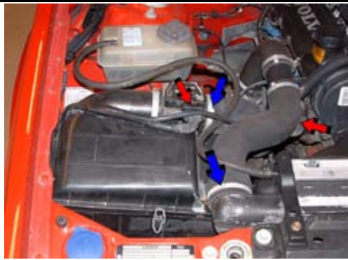
2. Lossa kontaktstyckena (röd pil). Demontera inloppsslangarna från LMM (luftmängdmätare) och intercooler (blå pil).