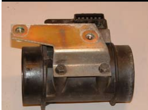
7. Demontera fästet från LMM.