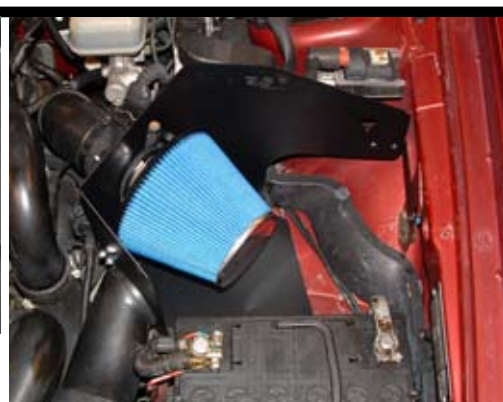
9. Montera luftmängdmätaren i avskärmningsplåten. Använd medföljande skruvar (2st). Montera luftkanalen och BSR luftfilter.