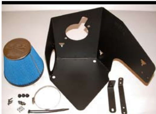
1. Innehållsöversikt opti-flow.