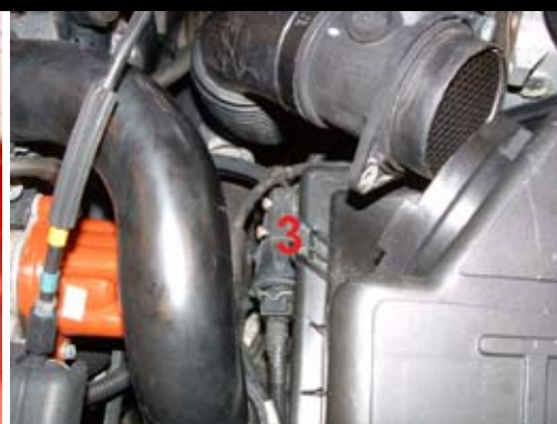
3. Lossa magnetventilen (3) och ev. kablage från luftfiltermodulen.