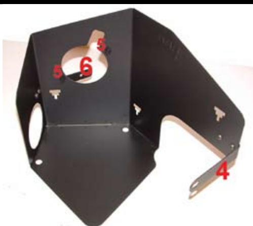
5. Förbered avskärmningsplåten med att montera staget till innerskärmen (4). Montera klipsen (5). Om bilen har fastskruvad magnetventil montera staget (6).

Dra sedan ut den från fästet i innerskärmen och lyft upp.