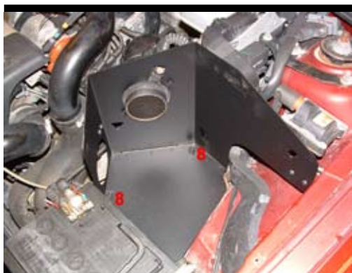
7. Montera avskärmningsplåten i bilen. Tryck ner så den träffar de två nedre originalfästena (8). Skruva fast fästet till innerskärmen med medföljande skruv.