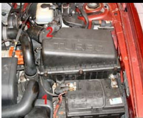
2. Demontera luftkanalen (1). Demontera luftmängdmätaren (2) från luftfiltermodulen.