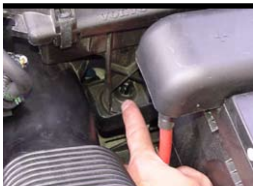
4. Dra luftfiltermodulens högra sida uppåt så den lossnar från de nedre upphängningsfästena.

Dra sedan ut den från fästet i innerskärmen och lyft upp.