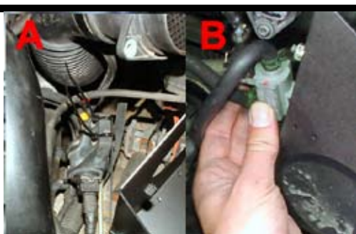
8. Om bilen har fastskruvad magnetventil, fäst med kabelbanden (A), annars fästs magnetventilen direkt i urtaget i avskärmningsplåten (B).