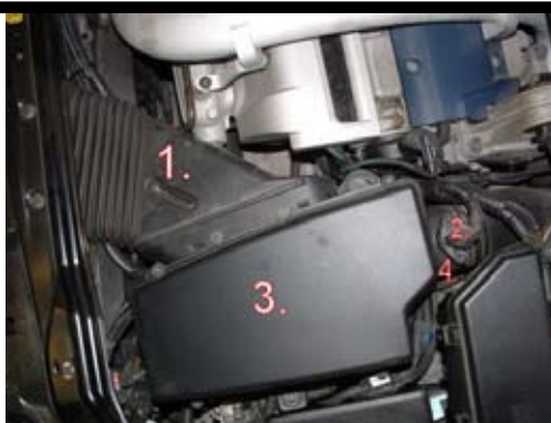
2. Demontering: Luftkanalen (1), kontaktstycket till luftmängdmätaren (2), luftfiltermodulen (3) och luftmängdmätaren (4) i ett stycke.