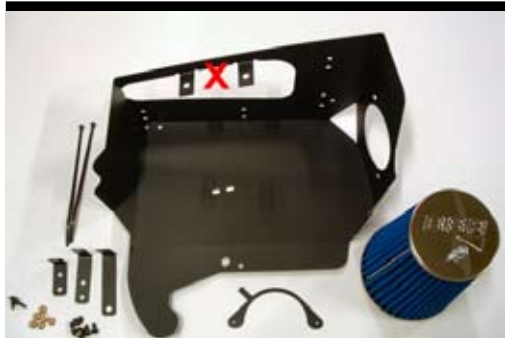
1. Innehållsöversikt Opti-Flow.