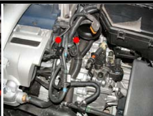
3. Demontera vakumslangfördelaren och slangpaketet från luftfiltermodulen. Flytta vakumslangarna till andra sidan kabelstammen.