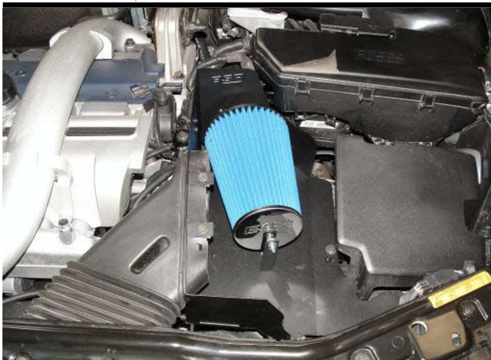
6. Montera avskärningsplåten i bilen. Använd originalskruvarna.