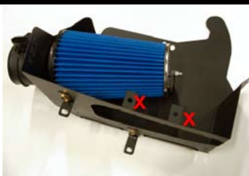
5. Vik stagen (X) för luftkanalen 90 grader enligt bild. Montera luftmängdmätaren på avskärningsplåten. Använd medföljande bricka och plåtskruvar. Stagen monteras enligt bild. Det kortaste högst upp. Det längsta till luftfiltret.