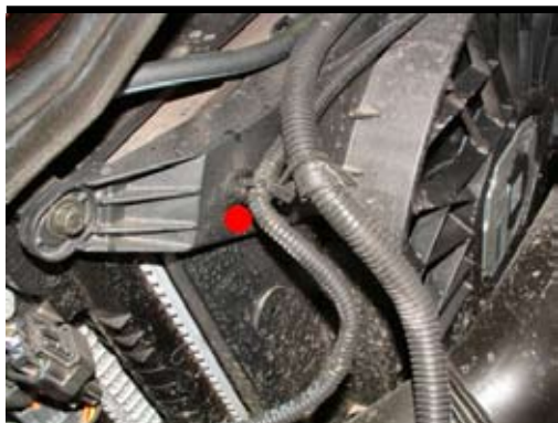
4. Lossa kablarna från klipset.